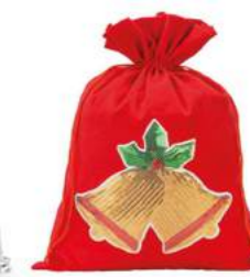
Z DOWOLNYM NADRUKIEM (WITH ANY PRINT)