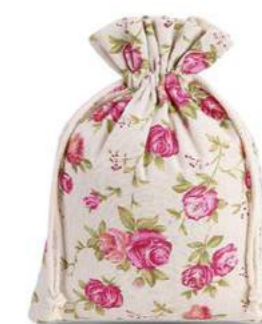
Z DOWOLNYM NADRUKIEM (WITH ANY PRINT)