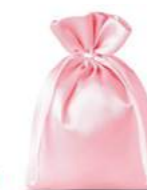
RÓŻOWY JASNY [LIGHT PINK]