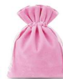
RÓŻOWY JASNY (LIGHT PINK)