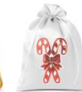
Z DOWOLNYM NADRUKIEM [WITH ANY PRINT]